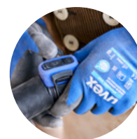
Télécommande Bluetooth Autosense