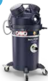
VHS010 HC Z22 EXA