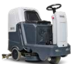
SC3500 Cea mai potrivită pentru suprafețe comerciale de mari dimensiuni