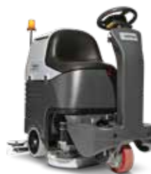
BR 652/752 Ideală pentru curățarea în spații înguste și pe coridoare