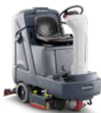
SC4000 Echipament de curățare a pardoselilor, cu post de conducere și performanță ridicată