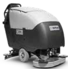
SC650 O soluție excelentă pentru curățare rentabilă