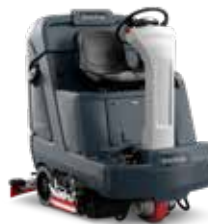
SC5000 Mașină de curățat pardoseli compactă și ușor manevrabilă