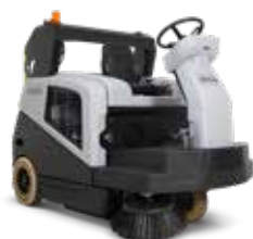
SW5500 Tehnologie hibridă în curățarea industrială