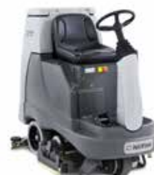
BR755 Accent pe calitate, ergonomie și fiabilitate.