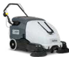
SW900 Mașină de măturat cu acumulator sau pe benzină