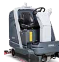
SC6000 Mașină de spălat pardoseli cu post de conducere, fiabilă și robustă, într-un design compact