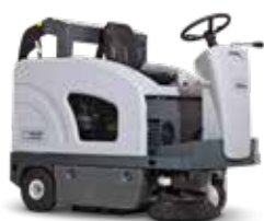
SW4000 Performanță excelentă, mai puțin praf