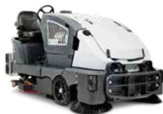
CS7010 1200B/1200D HYBRID În prezent, cea mai bună soluție de curățare a pardoselilor din punct de vedere ecologic pentru suprafețe mari.