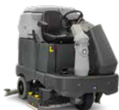
SC6500 Echipament cu post de conducere, de mare putere și eficiență, ideal pentru suprafețe extinse