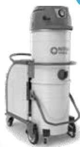
VHB436 cu baterii