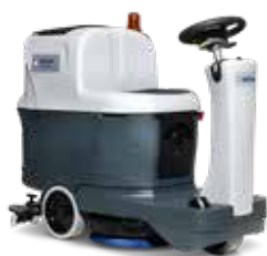
SC2000 Mașină de spălat pardoseli compactă cu post de conducere