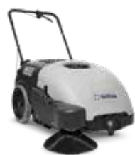
SW 750 Curățare silențioasă și ușoară