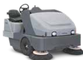
SR 1601 Soluție industrială pentru pulberi fine