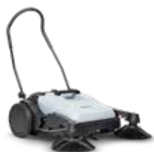
SW 200/SW 250 Mașină de măturat manuală