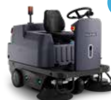
SW3000 Măturare eficientă, costuri reduse de operare