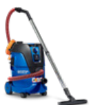
AERO 21/26 M/H