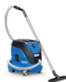
ATTIX 33 L