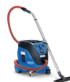
ATTIX 33 H