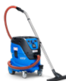
ATTIX 44 H