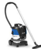
AERO 21 INOX