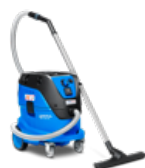
ATTIX 44 L