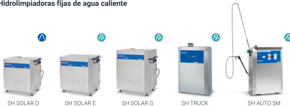
SH SOLAR D