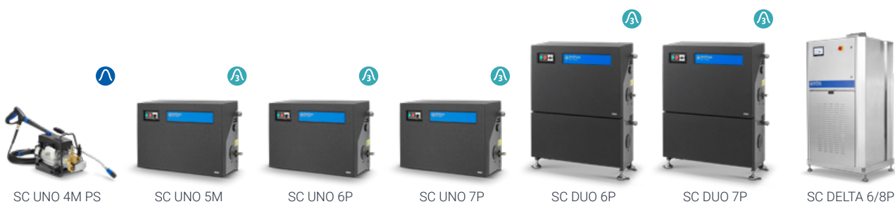
SC UNO 4M PS