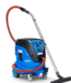
ATTIX 44 M