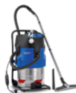
ATTIX 7 Special purpose