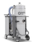
T series & TPlus series