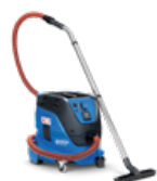
ATTIX 33 M