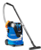
AERO 26 L