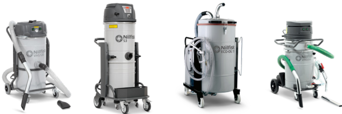
Industriesauger-Aktionsmodelle für die metallverarbeitende Industrie