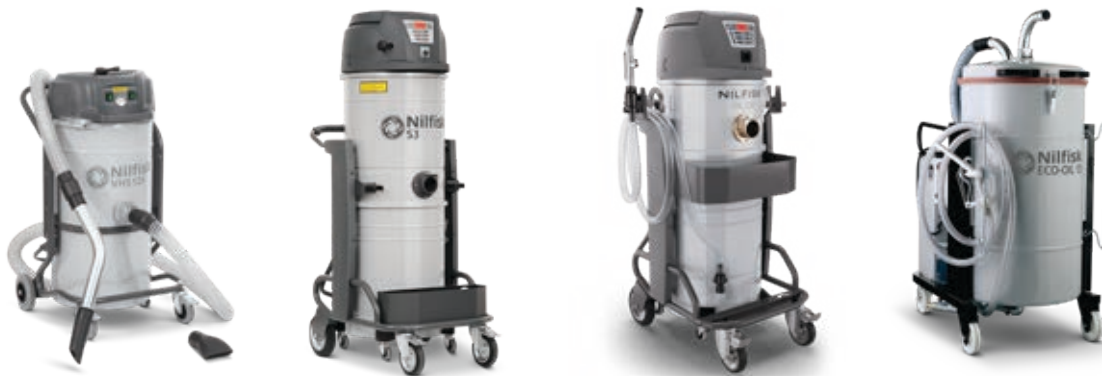
Industriesauger-Aktionsmodelle für die metallverarbeitende Industrie