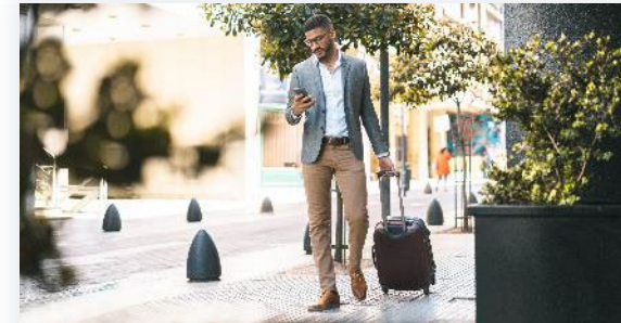
Hotel- und Gastgewerbe