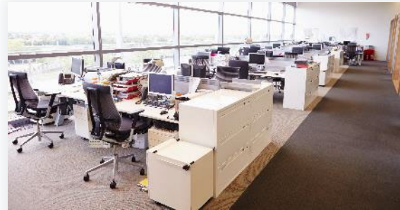
Öffentliche Verwaltung und Büros